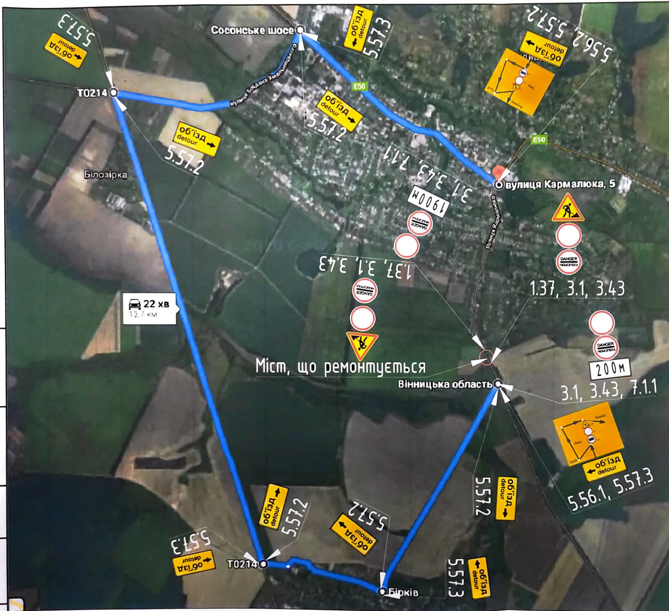
Схема організації дорожнього руху (об'їзду) під час ремонту